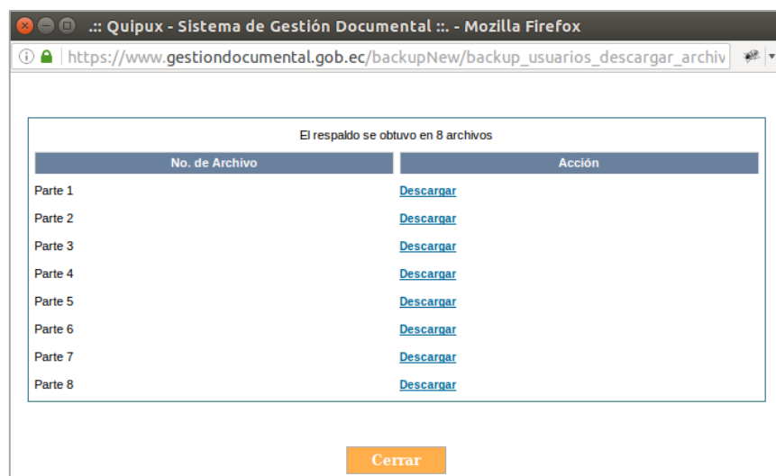
Ilustración 8: Varios archivos de descarga

zip -s 0 NOMBREDELRESPALDO.zip --out NOMBREDELRESPALDO_unificado.zip