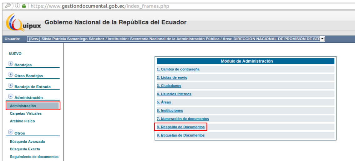
Ilustración 1: Administración → Respaldo de Documentos